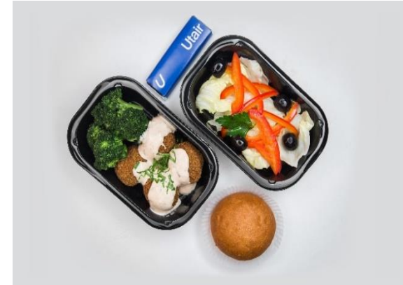
Фалафель с йогуртовым соусом. Салат из перца с оливками. Шоколад.