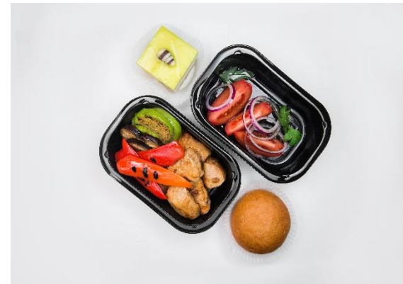
Шашлык куриный с овощами гриль. Салат из томатов с укропным маслом. Булочка. Пирожное «Лимончелло».