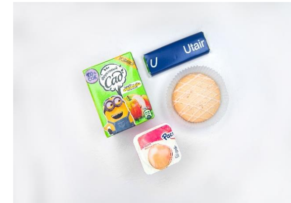
Детский набор. Десерт «Эрмигурт». Шоколад, сок 0,2 л.